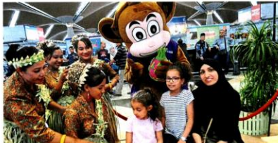
French tourists posing with Mah Meri dancers from Bukit Bangkulu and the Visit Sepang Year 2020 mascot at the launch of the tourism event by MPSepang at the start of 2020.