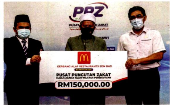
Menteri di Jabatan Perdana Menteri (Hal Ehwal Agama), Datuk Seri Dr. Zulkifli Mohamad Al-Bakri (tengah) menerima zakat perniagaan berjumlah RM150,000 daripada McDonald's Malaysia kepada PPZ-MAIWP.

Pada tahun 2019, McDonald's Malaysia merupakan entiti perniagaan yang pertama menerima Sijil Pengiktirafan Pembayar Zakat Korporat daripada PPZ-MAIWP.