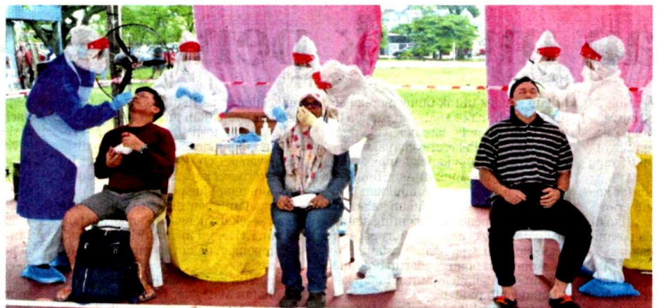
Petugas kesihatan Klinik Selcare melakukan ujian saringan COVID-19 secara percuma anjuran kerajaan Selangor dalam program ujian komuniti bersasar di Jalan Batu Unjur 3A, Taman Bayu Perdana, Klang, semalam.

"Bagaimanapun, kita belum dapat pastikan impak kesihatannya, sama ada mutasi A701V ini memiliki kebolehhajngkitan yang