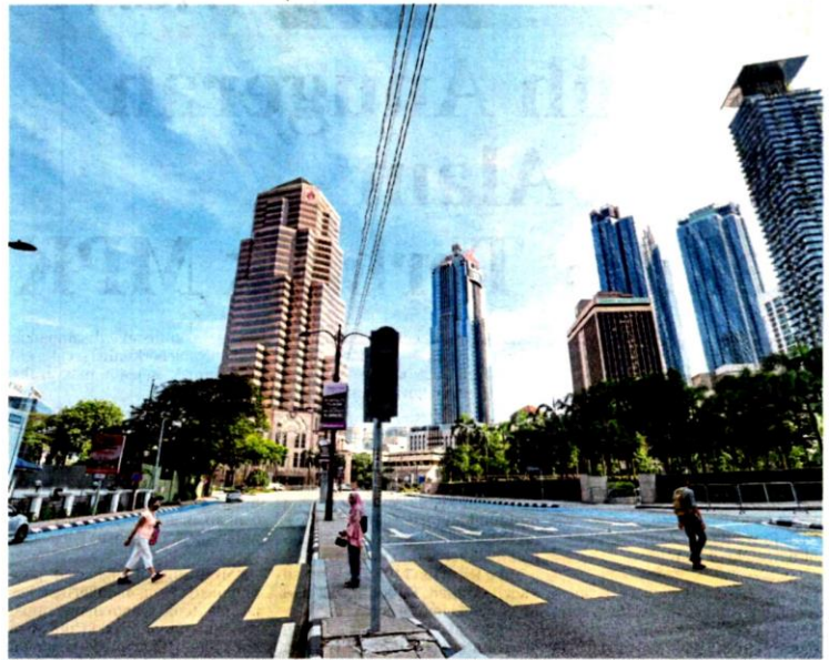
Ketika pelaksanaan PKP bacaan IPU di seluruh negara dalam keadaan baik dan sederhana, terutama di bandar besar dan kawasan perindustrian.

Pelaksanaan Perintah Kawalan Pergerakan (PKP) bermula 18