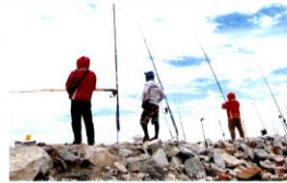
Tourism Malaysia's Surfcasting Tour was one of the events that attracted lots of interest among anglers.

The latter two lost their jobs due to the pandemic and are now hoping for a new start in different careers.