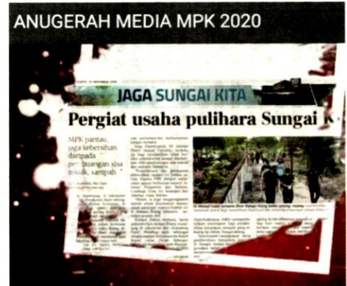
Laporan 'Pegiat usaha pulihara Sungai Klang' memenangi Anugerah Berita Alam Sekitar MPK 2020.

"MPK juga menghargai peranan media yang memberikan kerjasama baik dalam menyampaikan maklumat kepada masyarakat. Sumbangan dan sokongan media amat dihargai," katanya dalam ucapan sempena pengumuman pemenang anugerah berkenaan.