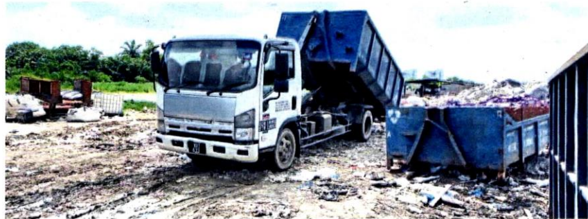
MPKL's enforcement team caught this lorry unloading rubbish at an illegal dumpsite at Sijangkang Utama in Telok Panglima Garang in July.

Locals, however, were not appeased, fearing that toxic chemicals leaking underground would result in the land being infertile.