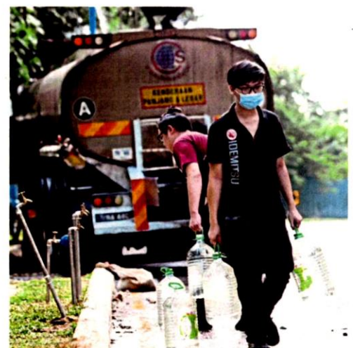
Orang ramai mengambil bekalan air bersih di pusat khidmat setempat dan pili awam ketika loji rawatan air ditutup akibat pencemaran bau.

di luar negara, termasuk beberapa bandar raya China seperti Shenzhen, Guangzhou dan Shanghai serta Itali yang turut mengenakan sekatan pergerakan, sekali gus mencatat penurunan kandungan nitrogen dioksida dengan drastik dalam udaranya.