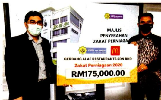
Penyerahan zakat perniagaan McDonald's Malaysia kepada Lembaga Zakat Selangor berjumlah RM175,000.

Untuk maklumat lanjut, sila layari www.mcdonalds.com.my .